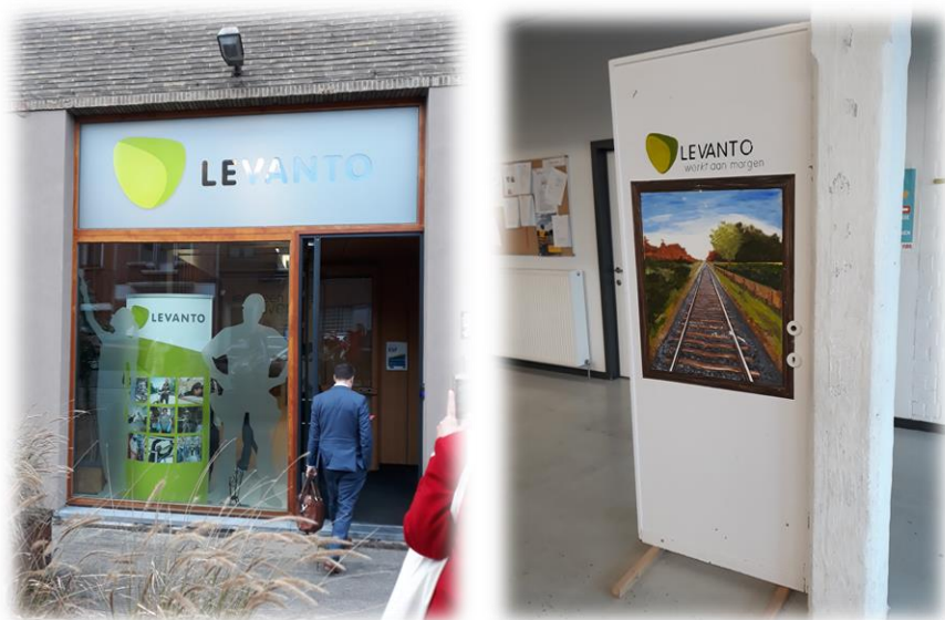
Sociální podnik Levanto – Antverpy

Velmi důležitou součástí úspěšného fungování sociálního podniku Levanto je intenzivní podpora ze strany města (politická podpora) a významných partnerů, kterými jsou další zaměstnavatelé v regionu. Ti si často ze stávajících pracovníků Levanta vybírají své nové zaměstnance a udržují tak u nich pracovní návyky a také jim tím dávají možnost posunout se zase o kousek dál a rozvíjet své znalosti a dovednosti.