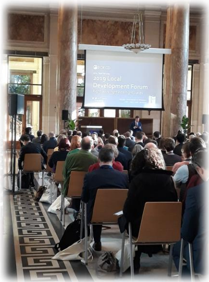
Přednáška Ensuring employers and workers meet in the middle