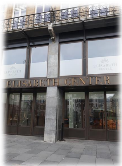
Místo konání konference – Elisabeth Center Antvepy

Ve dnech 10.-11. 12. 2019 proběhla v Antverpách mezinárodní konference OECD na téma „Right skills, right jobs, right places“. Toto téma bylo zvoleno s ohledem na vznikající potřeby trhu práce, které bezprostředně souvisí zejména s nastavováním procesů digitalizace a automatizace. Ke změnám, jenž tyto procesy přinášejí, patří nutnost zvýšit zájem zaměstnanců o celoživotní vzdělávání (ale také osob, které zaměstnání hledají) a dále také využití sociální inovace jako „pojítka“ se všemi příslušnými aktéry, kteří usilují o řešení problému (neziskové organizace, podnikatelský sektor a vládní sektor). Konference se zúčastnilo více než 100 účastníků z mnoha zemí – např. Kanada, Brazílie, Irsko, Švédsko, Černá Hora, Francie aj.