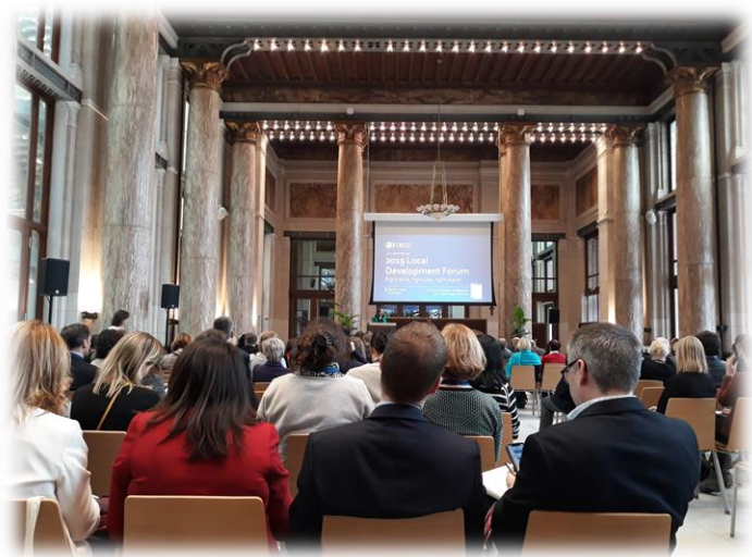
Závěrečná přednáška Building opportunity for all