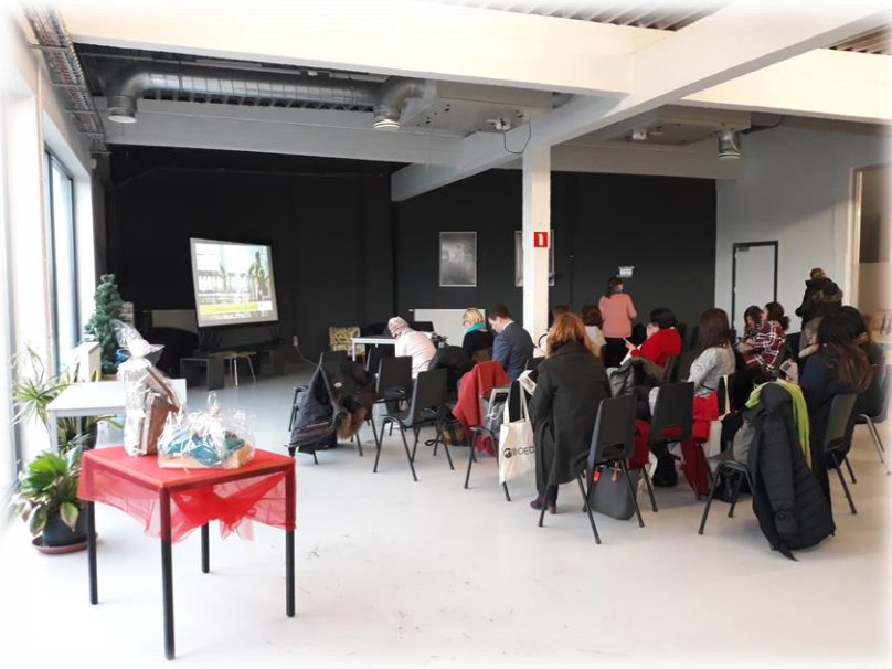
Interiér sociálního podniku Levanto